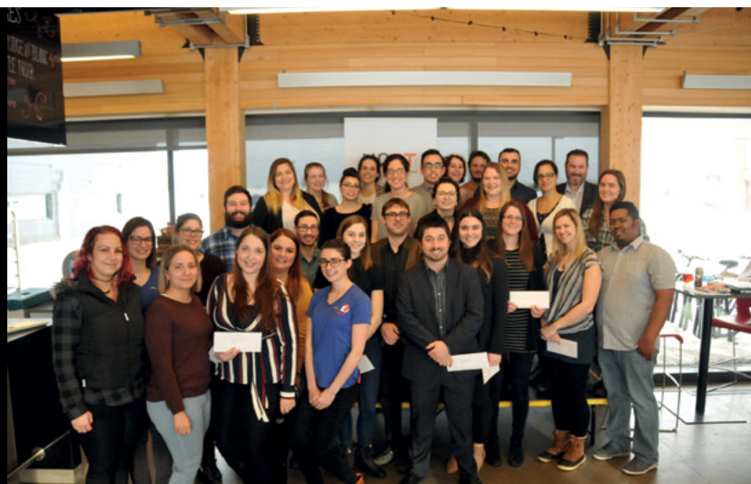
Mars 2018 - Remise des bourses aux étudiants du Fonds de développement des étudiants