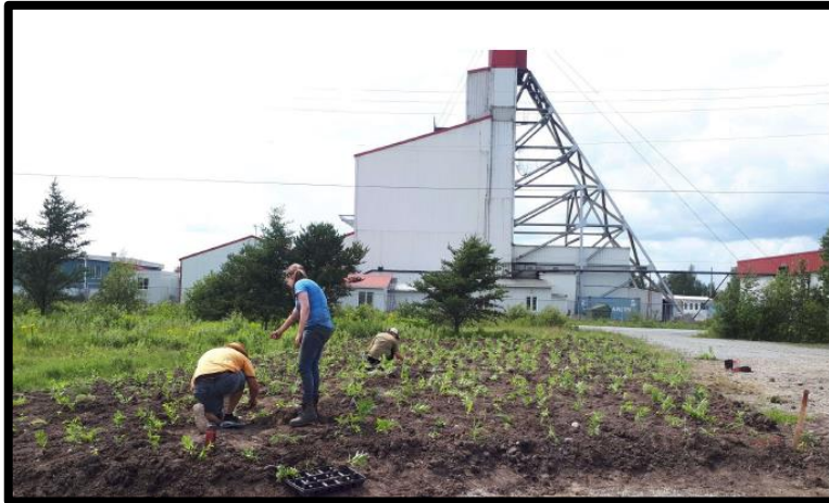
Parcelles d'essais Monarques Gold (2018)