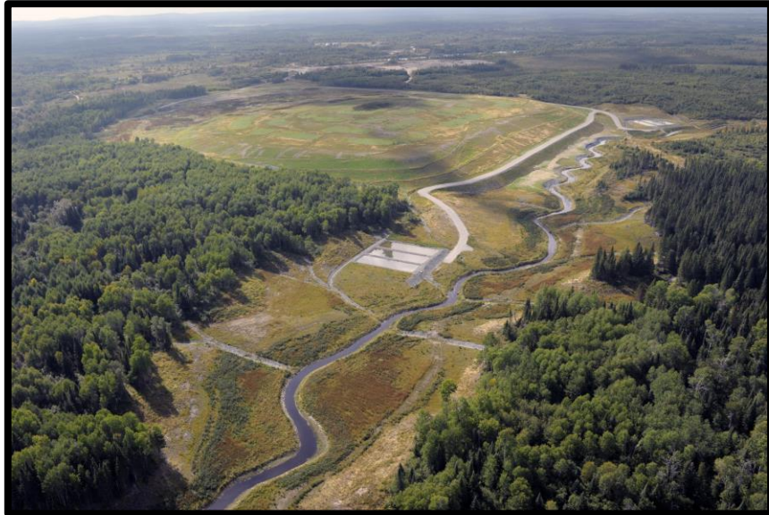
L'ancien site minier Barvue restauré par le MERN

Optimiser les efforts d'aménagement et de restauration de nos sites afin de créer des habitats propices au rétablissement des insectes pollinisateurs