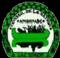
Nation Anishnabe de Lac Simon