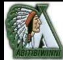
Première Nation Abitibiwinni