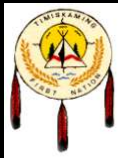
Timiskaming First Nation