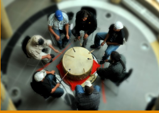
Joueurs de tambour, Pavillon des Premiers- Peuples

SUM Salle aux usages multiples, Pavillon des Premiers-Peuples