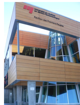
Pavillon des Premiers-Peuples